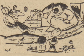
Popatrz się, jak mamusia i tatuś, bawią się w wojnę...! („Weltwoche”)