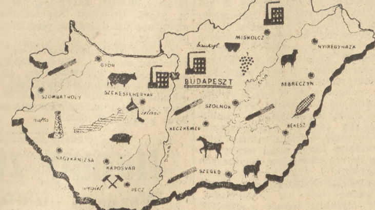
Mapa gospodarstwa Węgier

Realizacja planu trzyletniego wpłynie na polepszenie stanu materialnego ludności i na umocnienie gospodarki Węgier. Dochód na rodowy, który w wyniku wojny spadł z 22,5 miliardów foryntów (1938) do 7 miliardów foryntów 1946 47, osiągnie w r. 1950 sumę 25,7 miliardów foryntów, to znaczy przewyższy poziom przedwojenny o 11,4 proc. Demokratyczne Węgry weszły zdecydowanie na drogę planowego rozwoju bez jakiegokolwiek „pomocy” marshallowskich kapitałów.