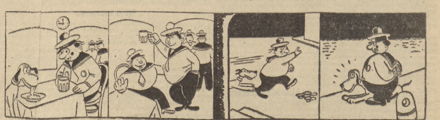
Przy stole zasiadli nierzadko inni goście. Onufry — marynarz i „Zagraja”, co posidił.