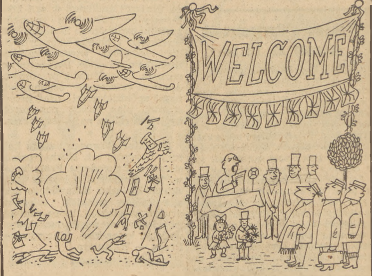
Niemcy odwiedzają Anglię... w roku 1940 — w roku 1948! Rys. Gwidon Miklaszewski