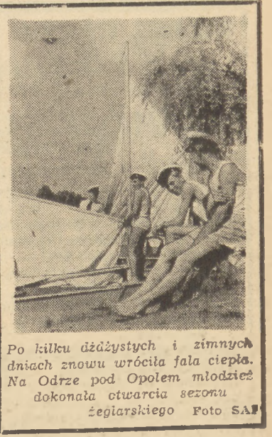
Po kilku dżdżystych i zimnych dniach znowu wróciła fala ciepła. Na Odrze pod Opolem młodzież dokonała otwarcia sezonu żeglarskiego.

W kraju, gdzie aparat państwowy nie znajduje się w rękach ludu, wońność może być jedynie wynikiem walki i dlatego też lud włoski odniósł zwycięstwo — największe, jakie mógł odnieść w tych okolicznościach. Zrozumieli to jego wrogowie i dlatego triumf swój tak skromnie obchodzą. Pierre Courtade