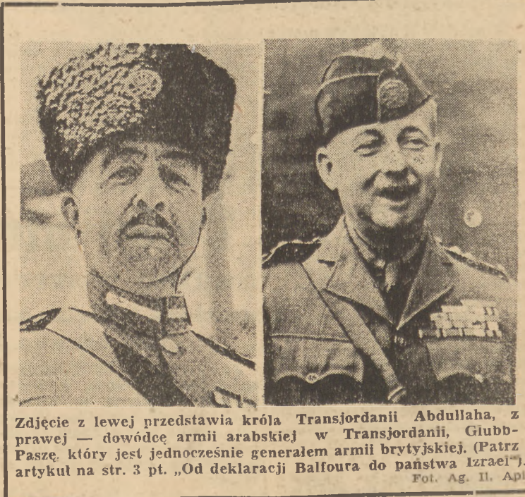
Zdjęcie z lewej przedstawia króla Transjordanii Abdullaha, z prawej — dowódcę armii arabskiej w Transjordanii, Glubb-Paszę, który jest jednocześnie generałem armii brytyjskiej. (Patr artykuł na str. 3 pt. „Od deklaracji Balfoura do państwa Izrael”).

tów całego świata w ich zdecydowaniu. Wszędzie pod różnymi postaciami toczy się ta sama walka, — powszechny i międzynarodowy bój między siłami przyszłości a przeszłości. Prawdą jest, że nasze warunki walki są odmienne od waszych. My na przykład musimy niszczyć w Europie liczne pozostałości faszyzmu, faszystowskich dyktatorów oraz ich wspólników; musimy zwalczać starego ducha kolonializmu, który przeciwstawia się wyzwoleniu narodów. W walce tej wy i my mamy wspólnych wrogów. Każde wasze powodzenie odbije się u nas silnym echem. Dlatego też witamy waszą inicjatywę.