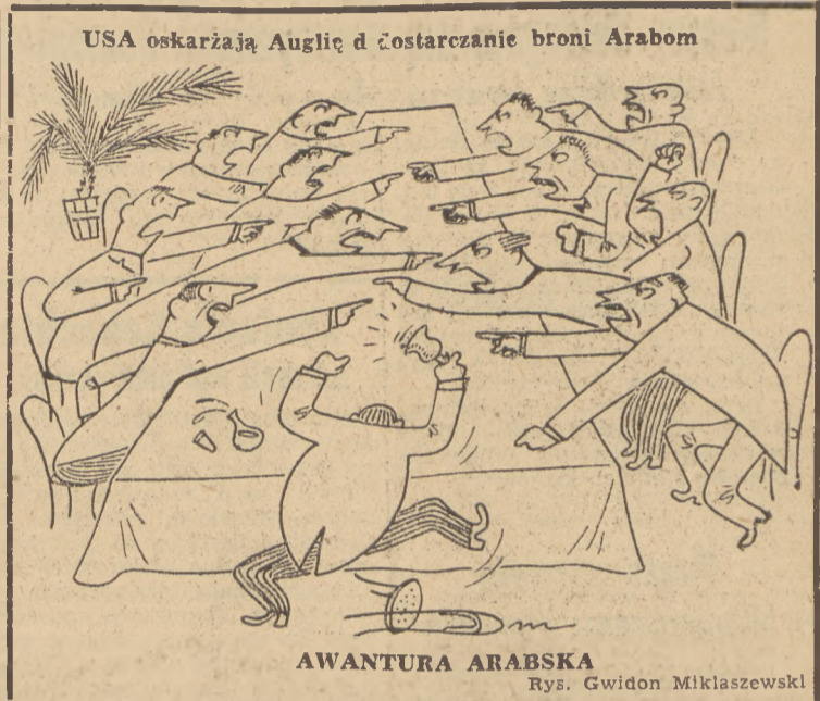
USA oskarżają Anglię o dostarczanie broni Arabom

Poparcie, udzielane przez Wielką Brytanię legionowi arabskiemu, spotkało się z jednogłośnie potępianiem dzisiejszej prasy amerykańskiej. Wszystkie dzienniki twierdzą zgodnie, że argumenty brytyjskie, mające uzasadnić to postępowanie, pozabawione są wszelkich podstaw. Komentator radia waszyngtońskiego oświadczył wręcz, że polityka Wielkiej Brytanii zagraża istnieniu Org. Narodów Zjednoczonych.