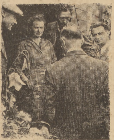
Przedstawiciele ambasady R. P. w rozmowie z repatriantami.

Gdyby ktoś, znalazłszy się tu przypadkowo nie wiedział, że No- gent le Perruex leży tuż pod Pa- ryżem, trudno by mu było wy- tłumaczyć, że jest we Francji. We wszystkich bowiem kawiarniach,