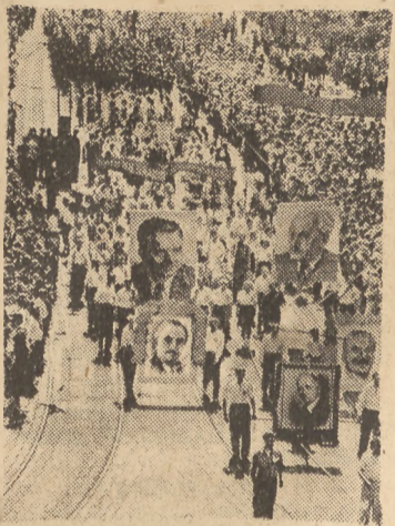
Pochód 200 000 rolników na Vaclav- skem Namesti w dniu 16 maja br.

Fundamentalna ustawa nowej ludowo-demokratycznej republiki ogłoszona została uroczystie na Hradczynie w sali, która już dwukrotnie widziała wybór prezy- dentów Czechosłowacji (T. G. Massaryka i E. Benesa), w sly- nej Sali Władysława, zbu-