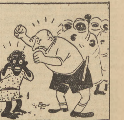
W starym mieście na wybrzeżu Podziwiali minarety, Białe domy, czarnych mężczyzn, Czarne dzieci i kobiety.