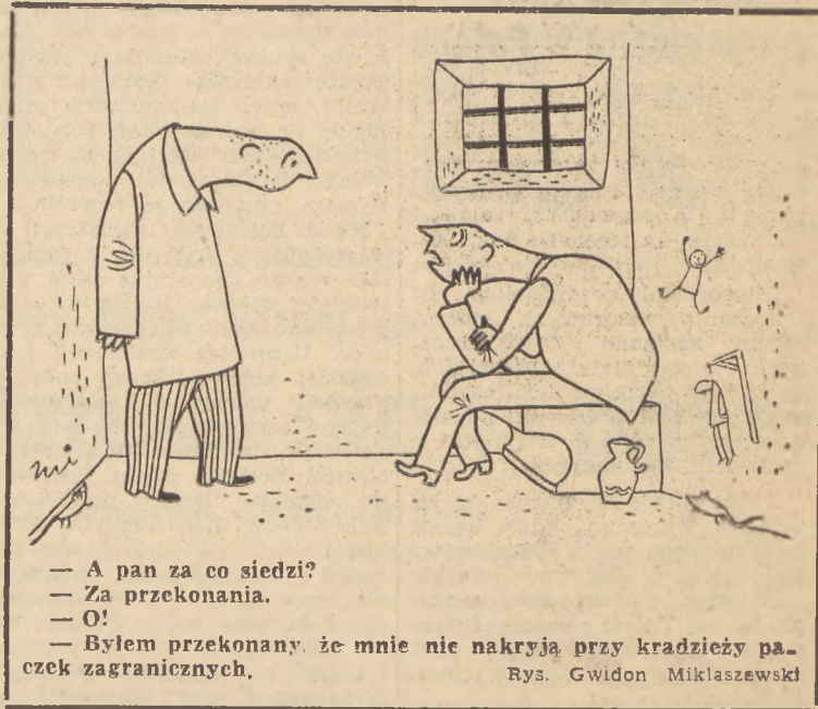
— A pan za co siedzi? — Za przekonania. — O! — Byłem przekonany, że mnie nie nakryją przy kradzieży pa- czek zagranicznych. Rys. Gwidon Miklaszewski

Nieoczekiwane przybycie gen. Robertsona do Danii, mające na celu podporządkowanie tego kraju żądaniom monopolistów anglosaskich i stworzenia z Danii narzędzia w ręku Anglosasów speliło na niczym, polegając jeszcze na niechęci opinii duńskiej do wszelkich kroków pachnących współpracą z Anglosasami. (jb)