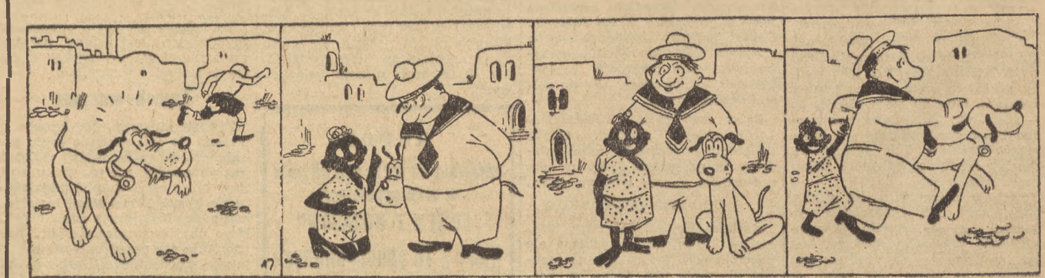
Biały brutal było zmyka, Psu wyrwawszy portki z pyska. Zagraj, pełen pieskiej dumy Łatke w zębach mocno ścisną. Przed Onufrym na kolana Mały Murzyn kornie pada: „Ali ciebie mnóstwo kochać. Mocna człowiek” — tak powiada. Uradował się marynarz, że hold taki go spotyka. „Chodź na statek, — rzecze chłopcu. Może zdasz się na kuchcikę.” Patrzcie tylko jak przykładnie Trójka drubów naprzód kroczy, Zagraj, podność nos do góry, Murzynkowi bliszczą oczy.