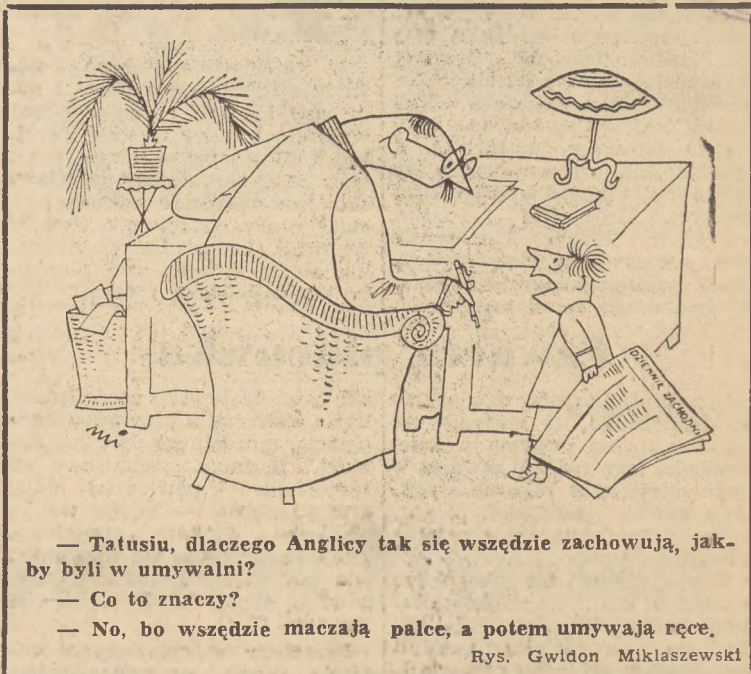
Rys. Gwidon Miklaszewski

Paryż. Odbyła się tu konferencja pomiędzy delegacjami parlamentarnymi brytyjskich i francuskich, na której wypowiedziano się za budowę tunelu pod kanałem La Manche. Odpowiedni wniosek w tej sprawie będzie wkrótce złożony w parlamentach obu państw,