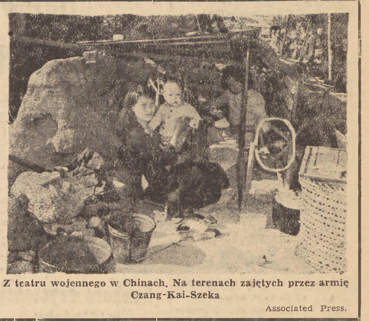
Z teatru wojennego w Chinach. Na terenach zajętych przez armię Czang-Kai-Szeka

Drugą część prac przy budowie prowadzi „Mostostal“. Filary nowego mostu śląsko - dąbrowskiego są już gotowe, a wkrótce rozpocznie się montaż mostu — najważniejszego odcinka nowej ar-