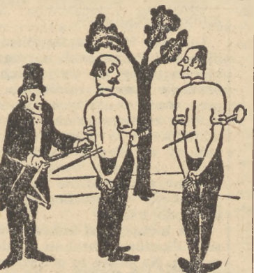
— W tym pojedynku wygrał pan o całe pięć centymetrów... („Regards”)