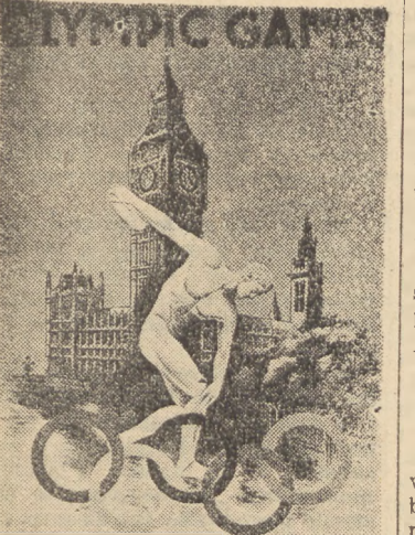
Tak wygląda afisz reklamowy XIV Olimpiady w Londynie.

A t e n y. W sobotę w południe na ruinach świątyni Zeusa na Olimpii dziewczyna grecka, ubrana w biały chiton zapaliła od promieni słonecznych za pomocą soczewki, gałązkę oliwną. Od roznie