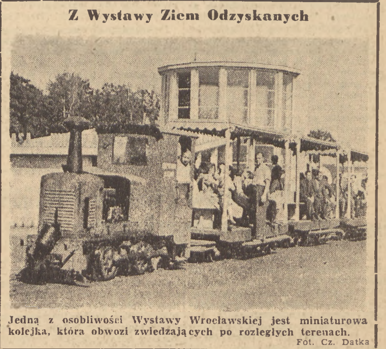
Jedną z osobliwości Wystawy Wroclawskiej jest miniaturowa kolejka, która obwozi zwiedzających po rozległych terenach.

Jeden z lekarzy dokonał amputacji przgniecionej nogi robotnika zwykłą piłą wyczyszczonej piaskiem i cegłą, ponieważ nie można jej było uwolnić spod gruzu. Strażacy opowiadają, że 80 żywych ludzi znajduje się w jednym z przywalonych budynków i że nie można się do nich dostać.