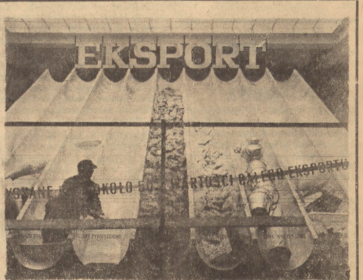
Wśród wielu pomyslowych eksponatów Wystawy Ziem Odzyskanych szczególnie zwraca uwagę przedstawienie udziału tych ziem w naszym handlu z zagranicą. Podstawowe grupy wytworów wypełniają część rynien, obrazując przystępnie stosunkowy udział tych towarów w ogólnej sumie wywozu.

Ostrawska „Prace” pisząc o przyjęciu, jakiego doznali Czesi w Polsce dodaje, że było to najserdeczniejsze przyjęcie, jakiego tylko mogli się przedstawiciele władz czeskich spodziewać.