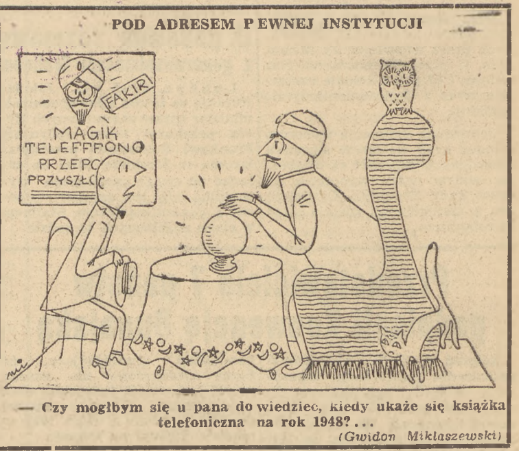
Czy mogłoby się u pana do wiedzieć, kiedy ukaże się książka telefoniczna na rok 1948?...

pierścienia szpiegowskiego”, dotyczący tym razem tajemnic produkcyjnej energii atomowej. Chroniąc z góry używaną przez komisję prowokatorkę Bentley, Thomas powiedział, że nie brała ona żadnego udziału w tym nowym „pierścieniu”. Nieoczekiwany wydarzeniem w rozwoju wypadków, związanych z wyszukiwaniem „szpiegów”, jest nagła śmierć na atak serca b. wiceministra skarbu White'a. White kilka dni temu katerycznie zaprzeczył prowokacyjnym doniesieniem, jakoby odgrywał czołową rolę w jakiegokolwiek „akcji szpiegowskiej”. Cała amerykańska postępowość opinia z Wallace'em na czele stwierdza zgodnie, że moralna odpowiedzialność za nagłą śmierć White'a ponosi komisja Kongresu dla badania działalności antyamerykańskiej.