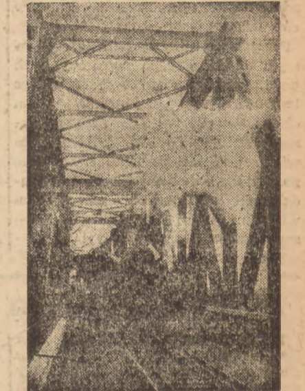
Na zdjęciu dolnym pociąg przejeżdża przez most na Odrze Wschodniej o dług. 225 m.