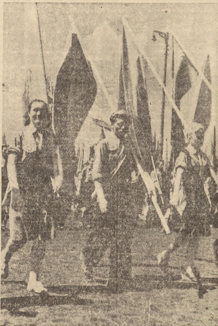
Defilada młodzieży na Złocie we Wrocławiu

Na terenie województwa krakowskiego już od wczesnych godzin porannych panował we wsiach ożywiony ruch. Dorośli i młodzież w odświętnych strojach zdążyli na uroczyste zebrania i akademie. We wszystkich gminach zgromadziły się w godzinach popołudniowych liczne rzesze mieszkańców wśród których wyróżniła się młodzież w regionalnych, barwnych strojach.