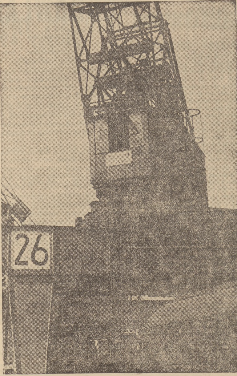
Dźwigi, wykonane w polskich fabrykach według projektów polskich inżynierów...