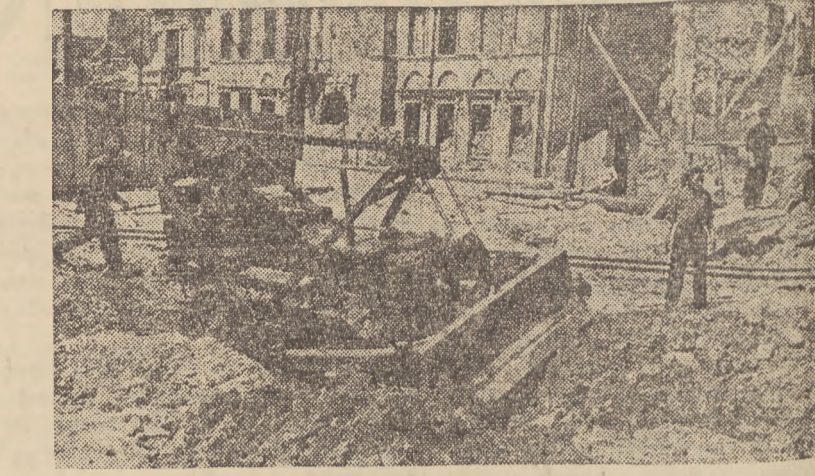
Prace przy budowie trasy Wschód — Zachód w W-wie trują nieprzerwanie. Największe nasilenie robót jest przy budowie tunelu w okolicy Pl. Zamkowego. Dzień i noc brygady robotnicze, pociągi towarowe i olbrzymie dźwigi pracują przy usuwaniu ziemi i zakładaniu stępki pod nowy tunel. Turbiny ssą z szęść. ziemi, kolej wąskotorowa i furgamki wywożą z trasy poza Warszawę.

Wczoraj około godziny 13 autobus „D”, zdążający z kierunku Dworca Głównego na Dworzec Wschod-