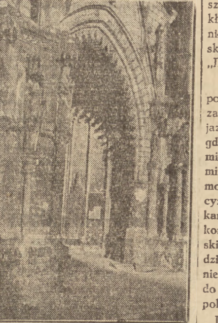
Wrocław — portal katedry

Najwyższy procent członków objęty został akcją zbiórkową w powiatowej organizacji Elbląga, wynosi on 98,1 proc. Na drugim miejscu, pod względem powszechności stoja organizacje powiatowe Malborka — 98,8 proc., Kwidzyna — 97,8 proc., Kartusy — 97 proc., Gdańska — miasta 93,3 proc., Tezewa — 92,3 proc., Gdyni — 92,2 proc.,