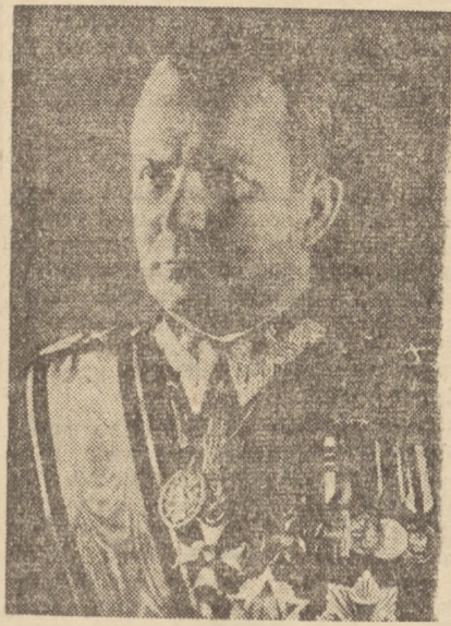
do żołnierzy ob. Marszałek powiedział m. in.:

W przemówieniu wygłoszonym do obywateli miasta Białej i Bielska oraz