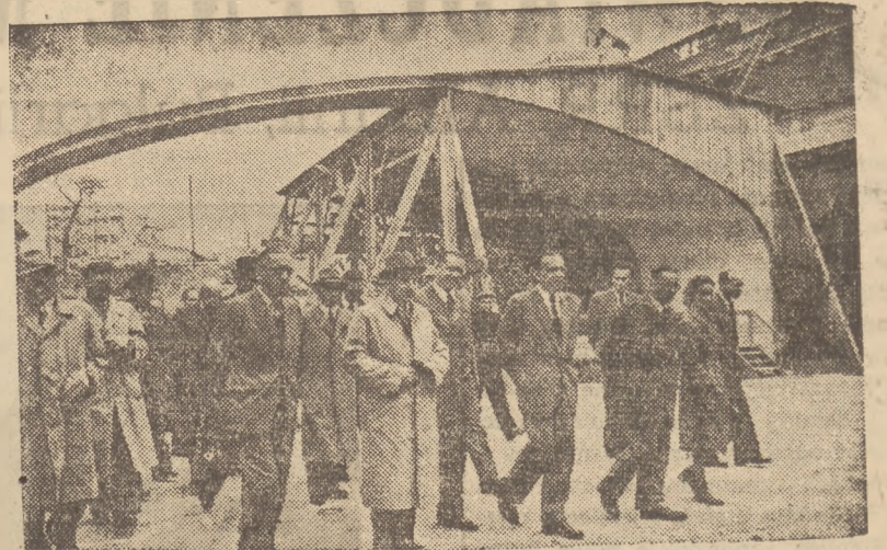
Na terenie budowy tunelu trasy W-Z rozpoczęto betonowanie tunelu. W związku z rozpoczęciem się robót betonarskich teren budowy odwiedził Prezydent RP Bierut w towarzystwie min. odbudowy Kaczorowskiego.