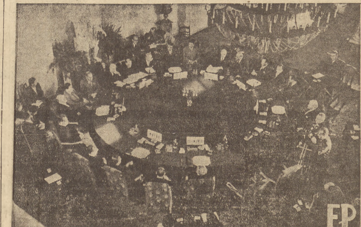
Ogólny widok sali obrad Konferencji Ministrów Spraw Zagranicznych w Warszawie.

Równocześnie decyzje konferencji londyńskiej wskazują, na czym polega istotne znaczenie „zachodniego sojuszu wojskowego”, utworzonego ostat-