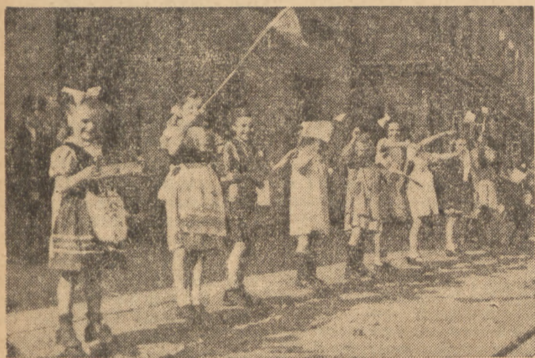
Dzieci witają przejeżdżających kolarzy

kającą czołówką. Po dwóch kilometrach, ten wspaniały kolarz, dochodzi do grupy.