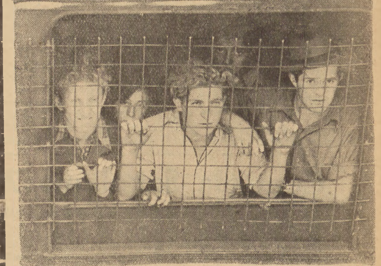
U góry: Pierwsza grupa nielegalnych imigrantów żydowskich opuszcza statek „Ocean Vigour” w Hamburgu. Doszło do dramatycznych scen. Między innymi kobiety, stawiały opór, tak że doszło do walki między żołnierzami brytyjskimi. Na zdjęciu widzimy żołnierzy brytyjskich, którzy przy pomocy pałek zmuszają imigrantów do wstania się na łódź. — W środku: W takich wagonach transportuje się chorych imigrantów do obozu w pobliżu Lubeki. Na zdjęciu (w środku) unieruchomiono zwozów z pasażerami. — U dołu: Większość imigrantów żydowskich przewieziono z Hamburga do Lubeki w wagonach kolejowych. Wszystkie okna były okratowane.