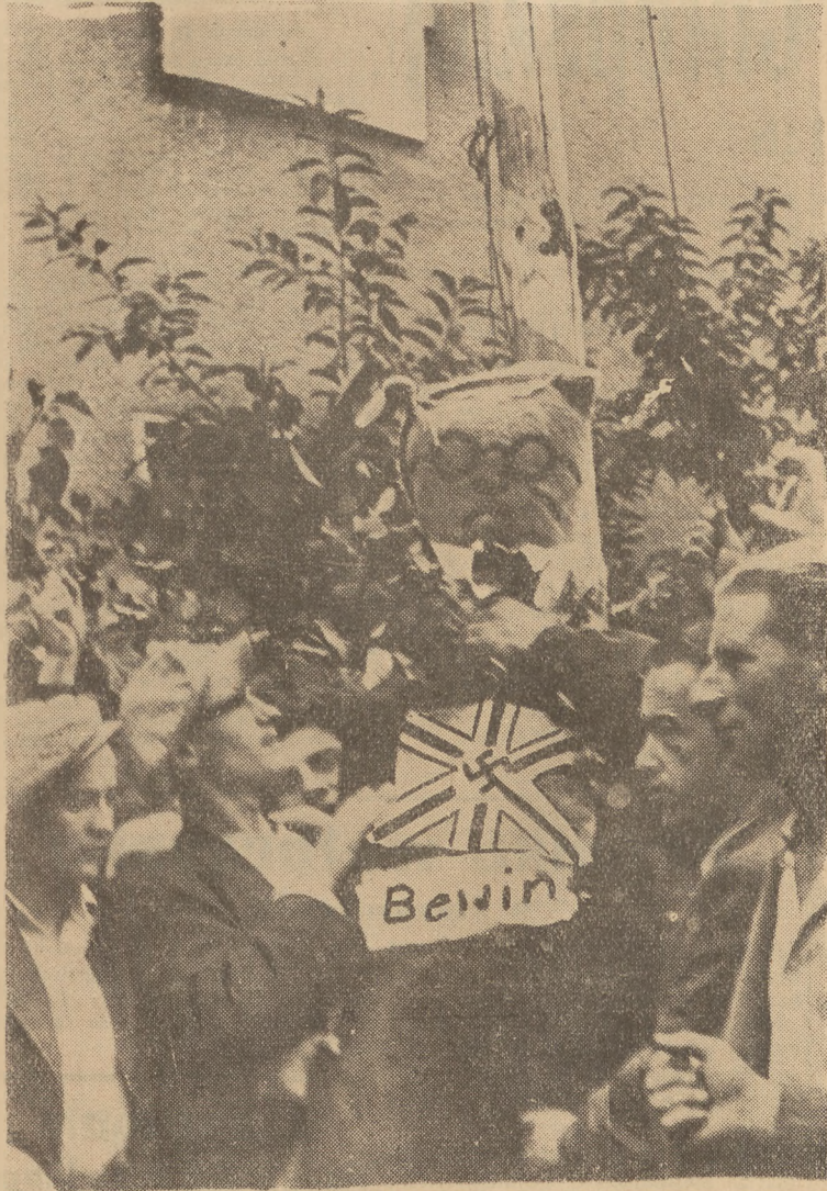
U góry: W obozie dla uchodźców żydowskich w Belsen odbyła się w przeddzień przyjazdu pierwszego okrętu z imigrantami do Hamburga demonstracja. Protestowano przeciwko przewożeniu Żydów do Niemiec. Podczas manifestacji wystawiono na pokaz publiczny kukłę przedstawiającą Bevina niosącego brytyjską flagę z niemiecką swastyką. — Z prawej: Żydowski imigrant przyjeżdżający do Hamburga na 3 okrętach transportowych. Pierwszy przybył w godzinach rannych 8 września br. Był to „Ocean Vigour”. Na zdjęciu widać przygotowane transporty kolejowe. Okna wagonów są okratowane.

Historia statku „Exodus”, na pokładzie którego znajdowało się kilkuset nielegalnych imigrantów żydowskich — jest już dobrze znana w całym świecie. Najbardziej jednak dramatyczne sceny rozegrały się w Hamburgu w czasie wyładowywania Żydów i przetransportowania ich do obozu pod Lubeką.