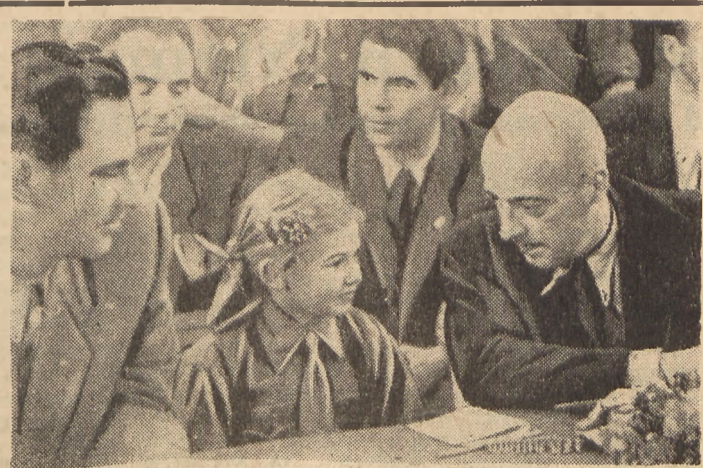
Ubiegłej niedzieli, w związku z Zjazdem Wojewódzkim Polskiej Partii Socjalistycznej, bawił w Katowicach sekretarz CKW PPS, premier Rządu Rzplitej J. Cyrankiewicz. Na zdjęciu Premier na sali obrad w rozmowie z najmłodszą członkinią, OMTUR.

Berlin. (PAP) Władze angielskie podały oficjalnie do wiadomości, że dowódca naczelny brytyjskich wojsk okupacyjnych w Niemczech marszałek wojsk lotniczych Sir Sholto Douglas ustąpił ze swego stanowiska. Następcą marszałka Douglasa mianowany został generał Sir Brian Robertson.