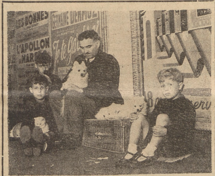
W Paryżu bardzo często w korytarzach kolei podziemnej spotyka się biedne rodziny, które handlują psami. Na zdjęciu biedna rodzina czeka na kupca. Chłopcy wierzą, że się... nie znajdą i będą mieli nadal w domu swoich towarzyszy zabaw Foto SAP.

Wpłacać w Urzędach Poczтовых na konto P. K. O. Nr. I—4695