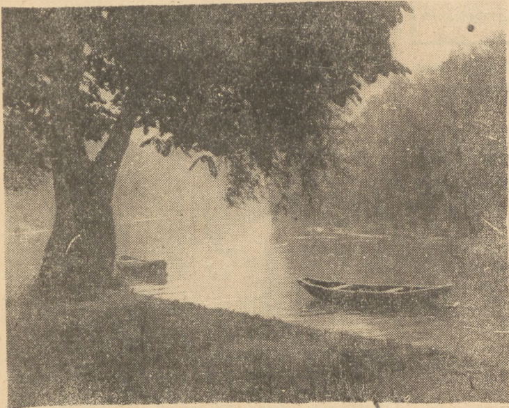
Wieczorem na Nysie Kłodzkiej