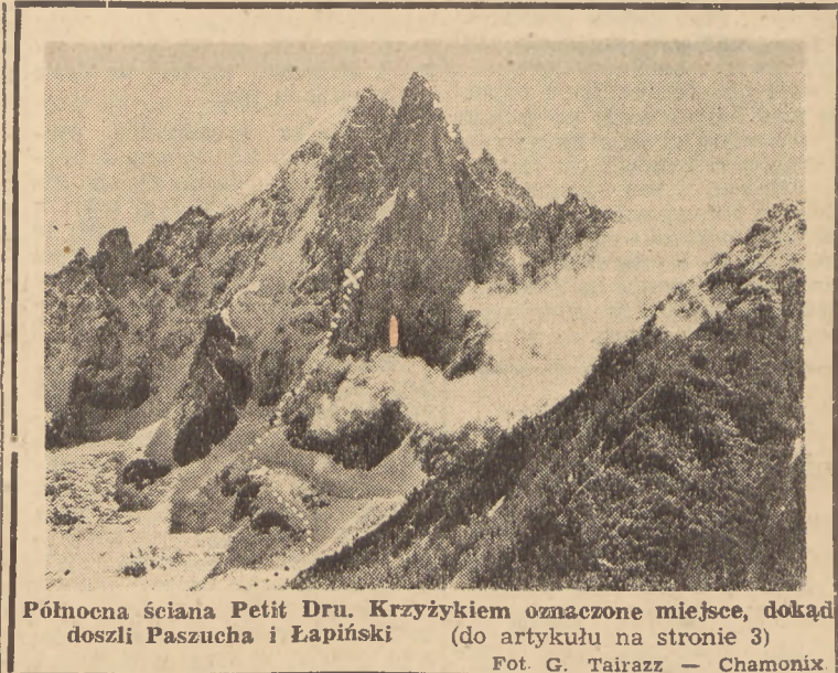
Północna ściana Petit Dru. Krzyżykiem oznaczone miejsce, dokąd doszli Paszucha i Lapiński (do artykułu na stronie 3)