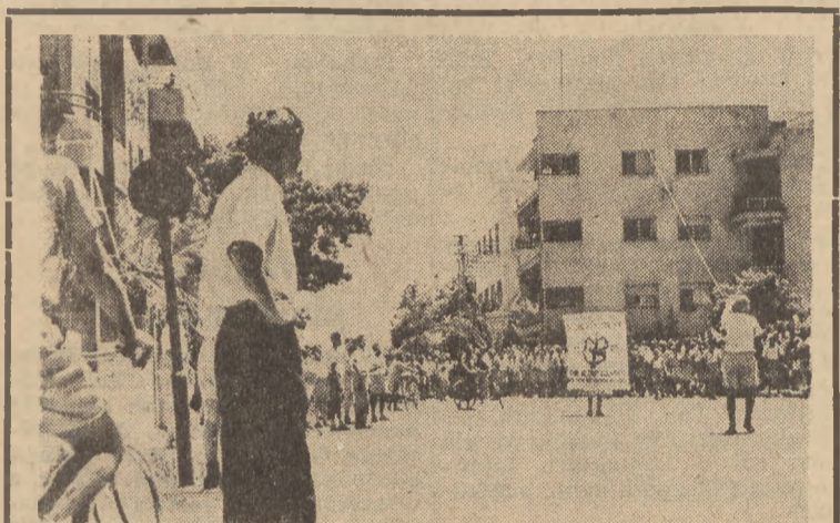
Palestyna żyje w stanie ciągłego wrzenia. Międzynarodowa interwencja nie może spowodować ewakuacji wojsk brytyjskich z tego kraju, a Żydzi nie ustają w propagowaniu hasła wolności. Na ulicach Tel Avivu można często spotkać pochody demonstrantów, domagających się zrealizowania żądań niepodległościowych.

Reforma rolna dała chłopom 5,6 mil. ha ziemi