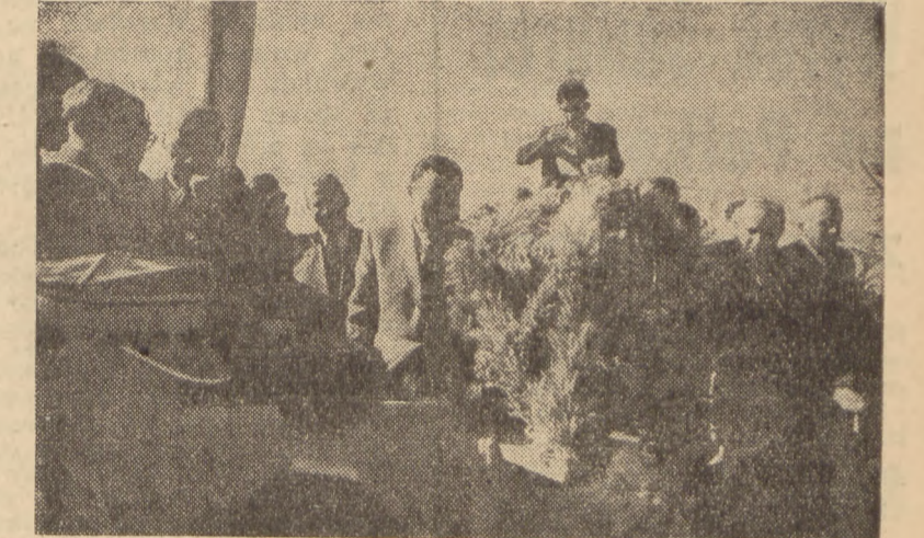
Wręczenie wieńców dożynkowych Prezydentowi Bierutowi na błonie nad Odrą w Opolu