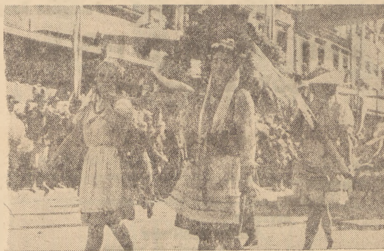
Dożynki na Śląsku.