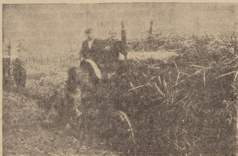
Traktorzysta ob. Wiczo orze poroście trzciną odwodnione tereny.