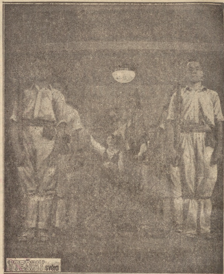
Zespół pieśni i tańca młodzieży hiszpańskiej

CENTRALNY ZARZĄD PRZEMYSŁU DRZEWNEGO Wydział Szkolnictwa Zawodowego poszukuje instruktorów do szkół stolarskich na wyjazd