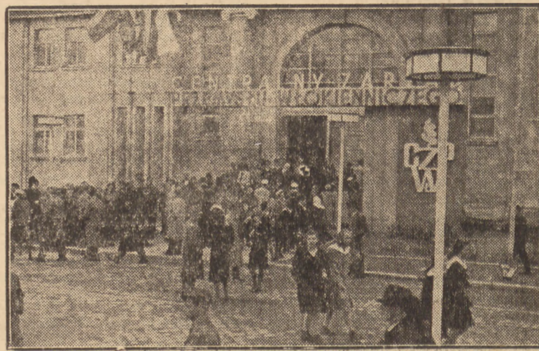
Przed pawilonem Centralnego Zarządu Przemysłu Włókienniczego jest, jak widzimy, rojno i gwaro