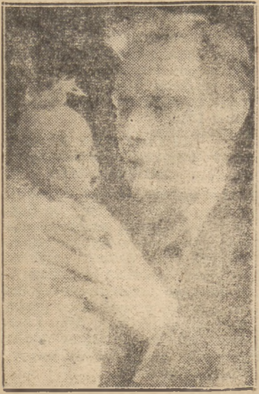
Sergiusz Obrazcow z lalką „Tiappa”