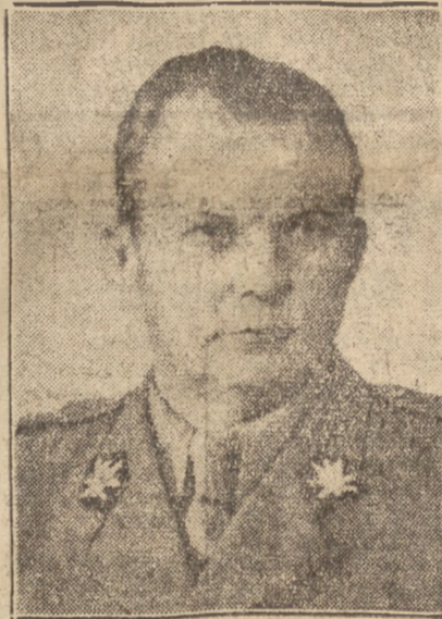
Marszałek Polski MICHAŁ ROLA ZYMIERSKI Minister Obrony Narodowej