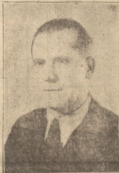
ANTONI KORZYCKI Wicepremier