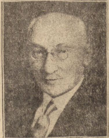
WŁADYSŁAW RZYMOWSKI Minister bez teki