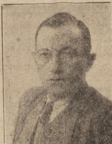
JAN RABANOWSKI Minister Komunikacji