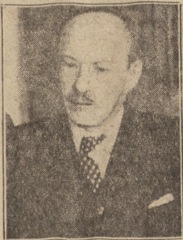
ZYGMUNT MODZELEWSKI Minister Spraw Zagranicznych