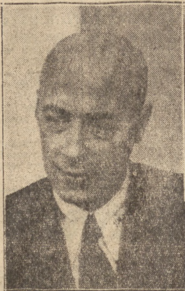
Premier J. CYRANKIEWICZ Sekretarz Generalny CKW PPS