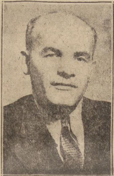
WŁADYSŁAW GOMULKA Wicepremier i Min. Ziemi Odzyskanych