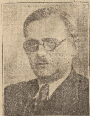
HILARY MINC Minister Przemysłu