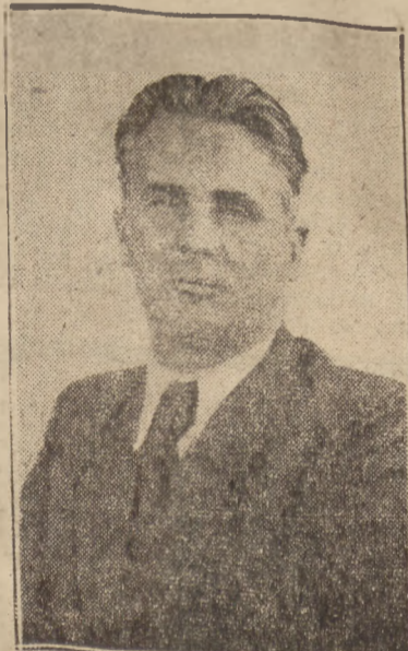
EDWARD OSÓBKA-MORAWSKI Minister Administracji Publicznej

Jest to wielki program pracy dla Polski, pracy dla narodu, pracy dla człowieka pracującego w Polsce. Bolesław Bierut będzie w urzędzie najwyższym kierownikiem tej pracy — przez najbliższych siedem lat.