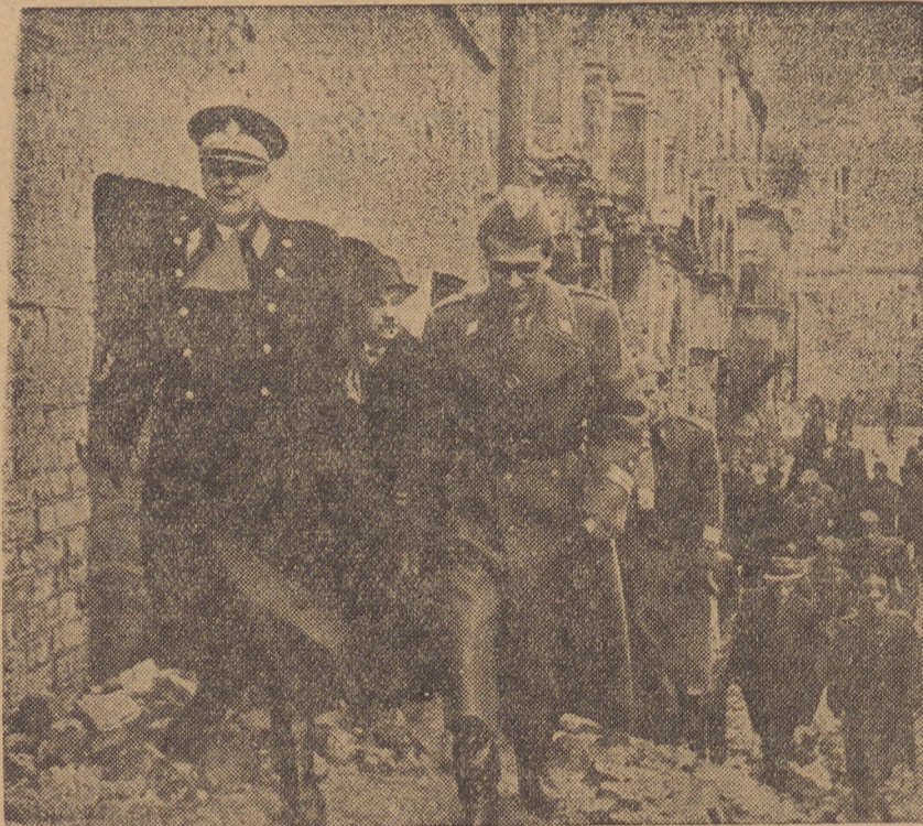
Marszałek Tito zwiedza gruzę Warszawy

Oddział warszawski „Społem“ przydzieli zapalki spółdzielczym i prywatnym podhurtownikom, u których je nabywać mogą detaliści, za okazaniem karty rejestracyjnej w cenie 90 gr za pudełko.