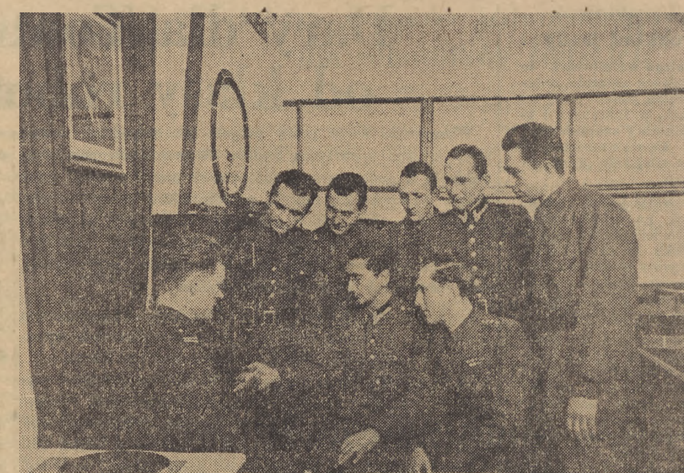
W jednej z jednostek łączności zorganizowano wystawę prac racjonalizatorów. Na zdjęciu racjonalizatorzy - żołnierze, którzy skonstruowali przenośny radiowęzeł.