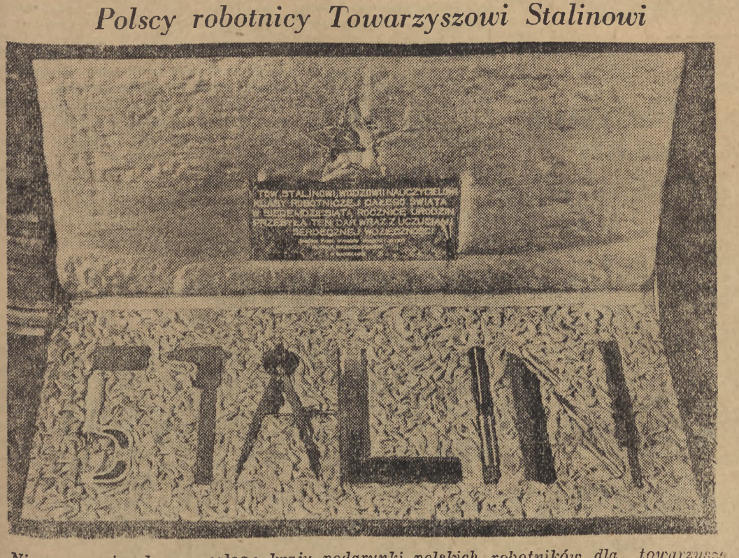
Nieprzerwanie płyną z całego kraju podarunki polskich robotników dla towarzysza Stalina. Na zdjęciu dar załogi fabryki im. gen. Świerczewskiego — kasety z precyzyjnymi narzędziami, ułożonymi w napis „STALIN“

W całym kraju zbiera się podpisy pod adresem, który będzie przekazany Stalinowi w dniu urodzin. Adres zawierać będzie 5.000.000 podpisów wartych w 103 tomach.