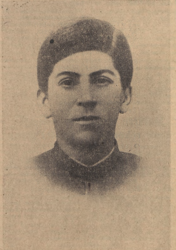
J. W. Stalin w roku 1893