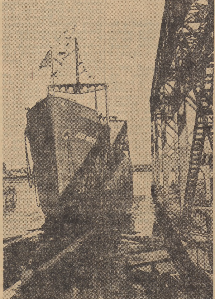
S/S „Wieczorek” jest szóstym rudowęglowcem wykonanym przez stocznię polską

Problem ten rozwiązał mistrz malarni Stoczni Północnej,