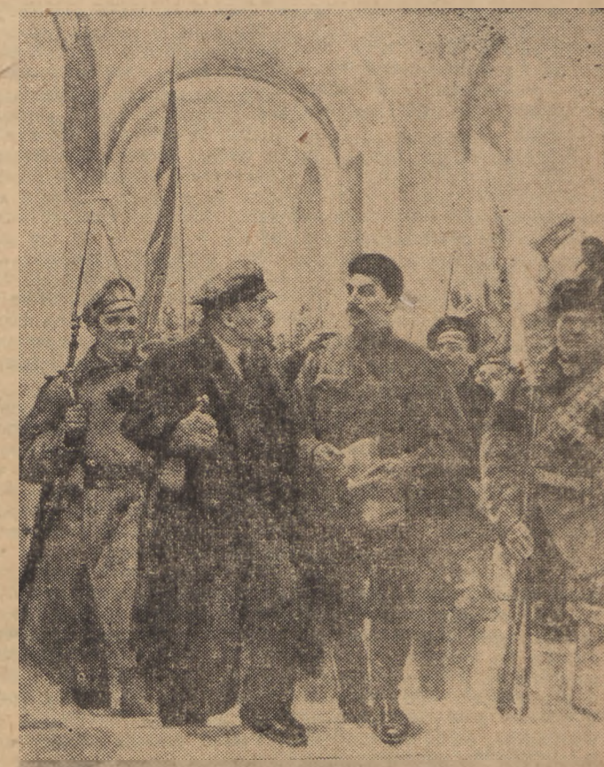
Lenin i Stalin w Smolnym. Rok 1917

Towarzysz Stalin twar do nieugiętych prowadził partię i masy pracujące do wykonania wielkich zamierzeń pierwszej pięciolatki i do przeprowadzenia powszechnej kolektywizacji rolnictwa na podstawie całkowitej likwidacji ostatniej klasy