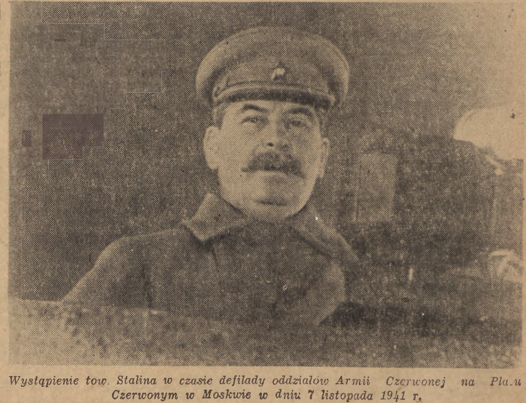
Wystąpienie tow. Stalina w czasie defilady oddziałów Armii Czerwonej na Placu Czerwonym w Moskwie w dniu 7 listopada 1941 r.