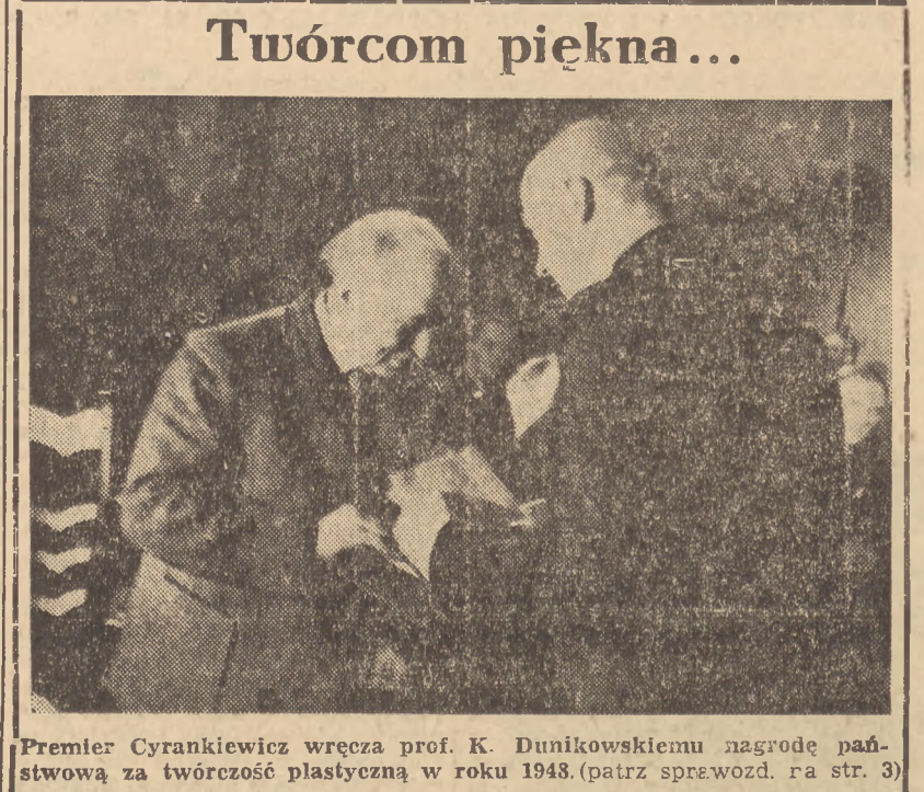
Premier Cyrankiewicz wręcza prof. K. Dunikowskiemu nagrodę państwową za twórczość plastyczną w roku 1948. (patrz sprawozd. na str. 3)

PRAGA 13.1. (PAP) W Pradze rozpoczęły się 13.1.1949 obrady mieszanej czechosłowacko-polskiej komisji, poświęcone zagadnieniom społecznym. W obradach biora udział ze