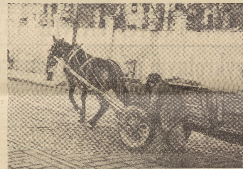
Czy każdy woźnica tak postępuje? Wjazd stromizną ulicy Książęcą — to ciężka praca dla konia. Trzeba mu ulżyć.

„Dziękuje Komitetowi Wojewódzkiemu i społeczeństwu województwa śląsko-dąbrowskiego za jego wybitną ofiarność na rzecz odbudowy stolicy, która znalazła swój wyraz w przekroczeniu już w chwili obecnej planu rocznego zbiórki na Stołeczny Fundusz Odbudowy Stolicy.“ (U)