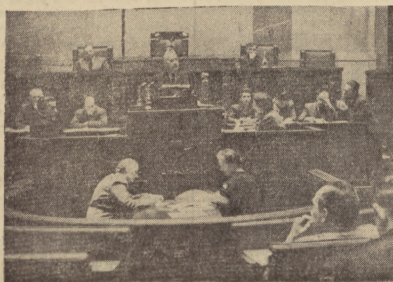
Premier J. Cyrankiewicz przemawia podczas wczorajszej sesji.