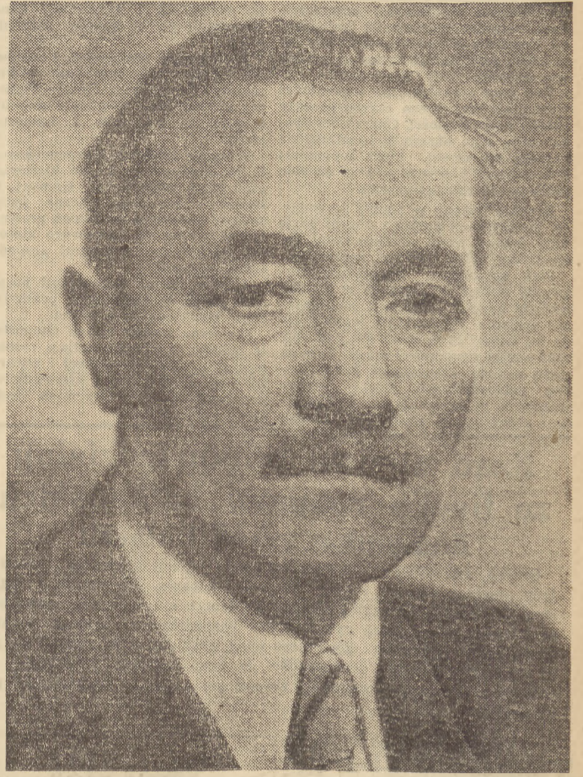
Dzisiaj mijają dwa lata od dnia, w którym Bolesław Bierut obrany został przez Sejm Ustawodawczy Prezydentem Rzeczypospolitej. W ciężkim okresie życia kraju, Prezydent Bolesław Bierut swe trudne i odpowiedzialne zadania wypełniał z sukcesem nie żalując sił, ani zdrowia w pracy dla Państwa.

Ogółem akademicy nasi zdobyli w tegorocznych mistrzostwach 6 złotych medali, 3 srebrne i 3 brązowe. (Szczegółowe sprawozdanie na str. 5)