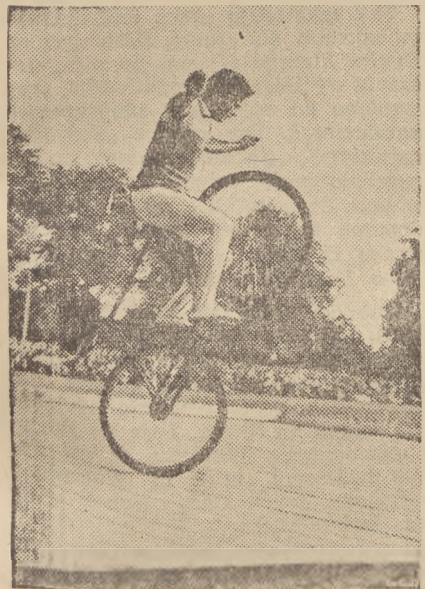
W wolnych chwilach pomiędzy etapami kolarze, biorący udział w wyścigu dookoła Polski popisują się akrobatyką rowerową.

WALKA kolarzy w tegorocznym Tour de Pologne staje się z każdym etapem coraz bardziej zacięta i nierzwykłej emocjonująca.