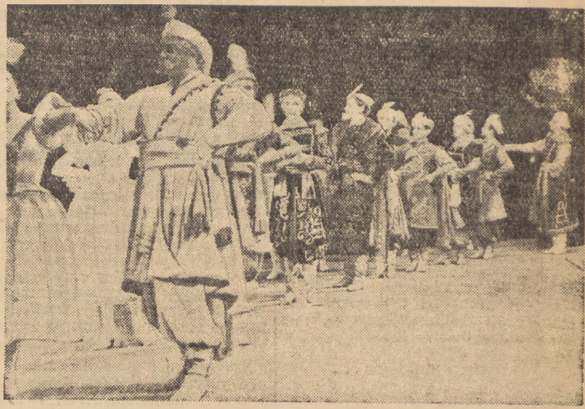
Zdjęcie nasze przedstawia fragment Poloneza z „Tanców Polskich” Glinki w wykonaniu Baletu Państwowego Akademickiego Wielkiego Teatru ZSRR...