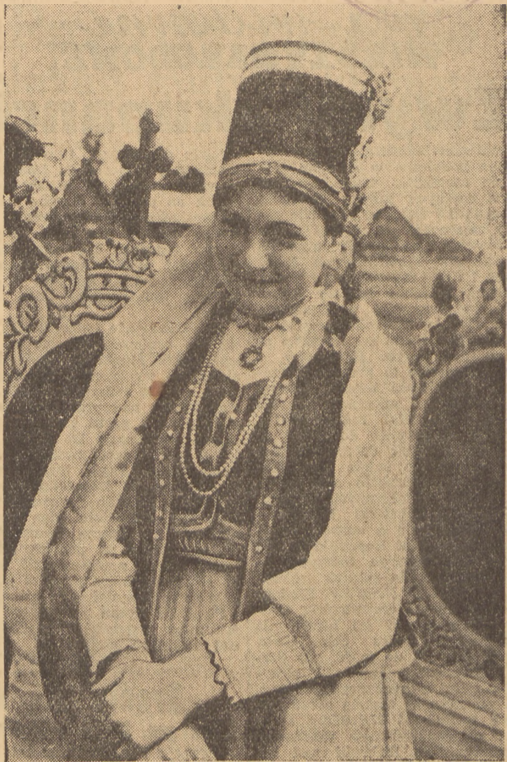
Barwne stroje ludowe na wsi ustępują miejsca fabrycznej tandecie. To smutne zjawisko powinno zainteresować organizacje wiejskie i Wydz. Kultury i Szuki właściwych urzędów. Na zdjęciu Kurpianka z pow. Ostrołęka w charakterystycznym „czołku“.