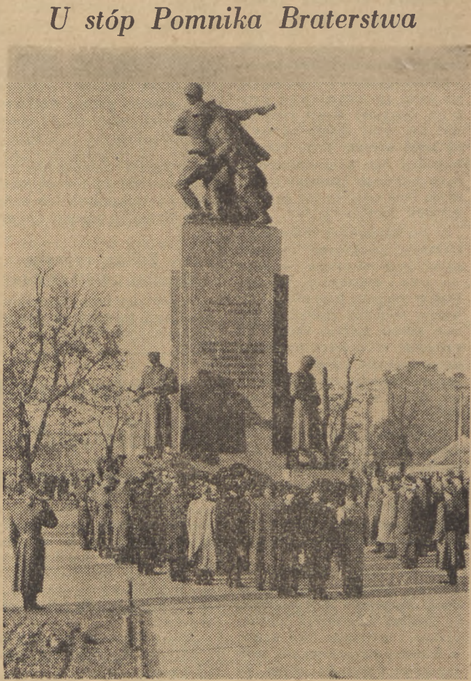
W Święto Umarłych delegacje partii politycznych, organizacji społecznych i młodzieżowych oraz Wojska Polskiego, złożyły wieńce pod pomnikiem Braterstwa Broni na Pradze

Pod sztandarem Lenina, pod przewodem Stalina — naprzód ku zwycięstwu komunizmu!