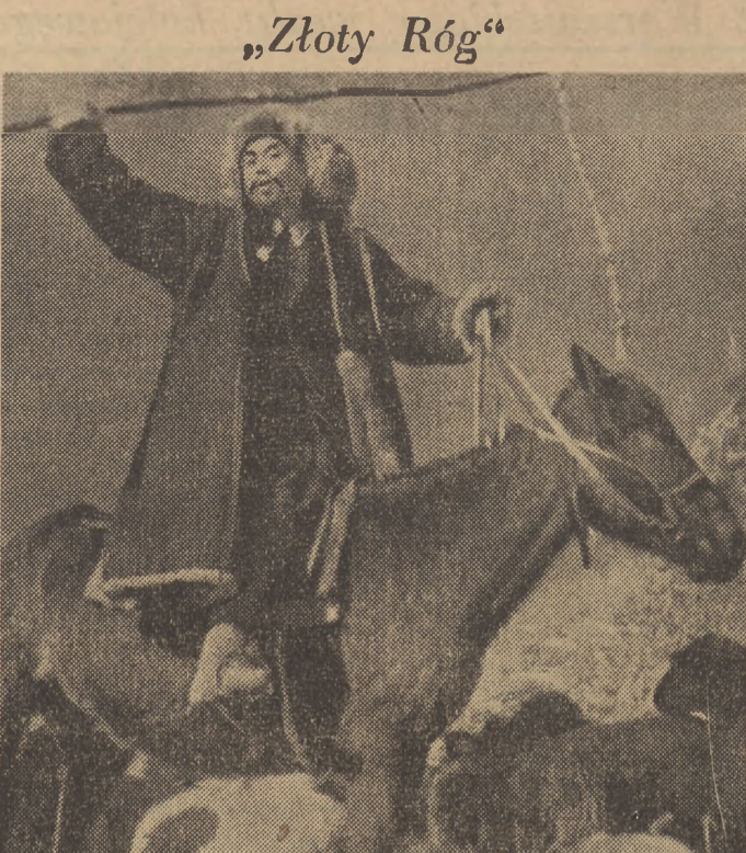
Scena z radzieckiego filmu „Złoty Róg”, wyprodukowanego w kazachskim studio w Alma-Ata

Metoda zwalania wszystkich win na nieżyjącego współnika zbrodni jest dość znana wśród gangsterów. Stosuje ją również i Manstein, zachęcony nadzieją na pewne szanse w bieku atlantyckim. Komedia hamburskiego procesu Mansteina jest bowiem wyraźnie zaaranżowana w celu wybielenia generałów niemieckich w oczach nacjonalistów i stworzenia mitu „niezwyciężonej” armii niemieckiej jeżeli dowodzić nią będą Mansteinowie i ich anglosascy protektorzy.