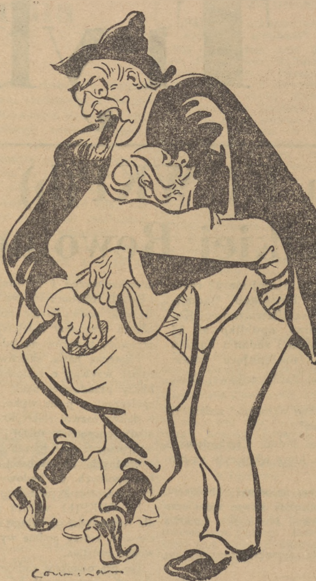
Rys. NOEL COUNIHAN