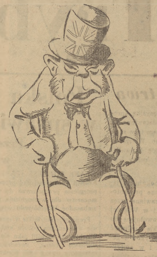
Rys. TADEUSZ MARCZEWSKI