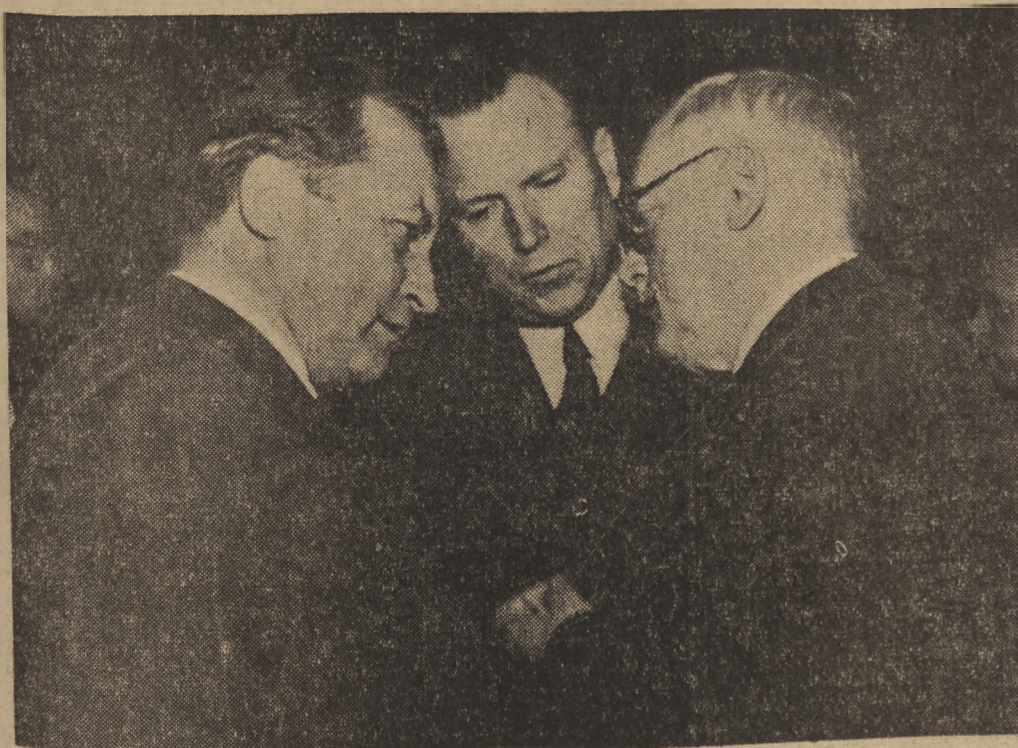
Od lewej czeskosłowacki minister spraw zagranicznych dr Vl. Clementis, delegat Ukrainy do ONZ — Jakub Malik i przewodniczący delegacji radzieckiej na Zgromadzenie Generalne ONZ min. Andrzej Wyszyński.