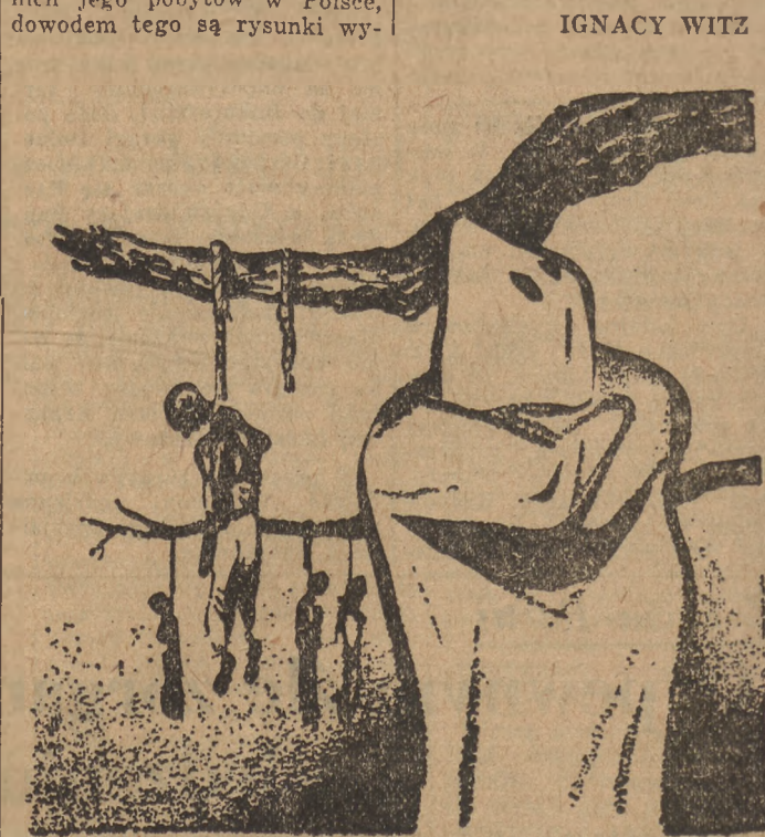
WILLIAM GROPPER Lyncb

Swoj pozytywny stosunek do mas pracujących całego świata, do interesów proletariatu, do walki, jaką prowadzi proletariatu o wyzwolenie, manifestuje Gropper swoim stosunkiem do Związku Radzieckiego, do krajów demokracji ludowej. Pokojowe budownictwo, droga do socjalizmu realizowana w tych krajach, jest doceniana przez niego i przyjmowana z entuzjazmem. Dowodem tego jest również wielka ilość rysunków o odbudowującej się Polsce, wykonywana przez Groppera w czasie dwu ostatnich jego pobytów w Polsce, dowodem tego są rysunki wy-