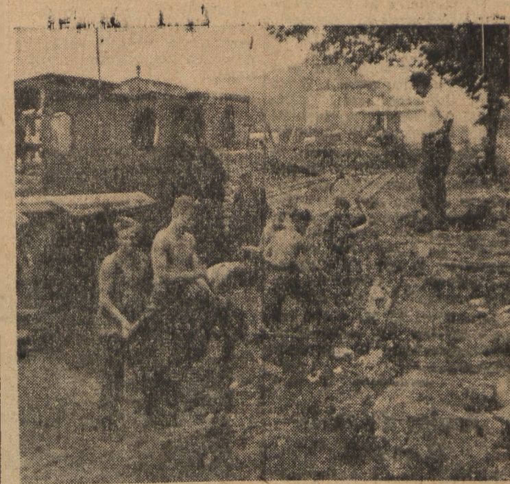
Udział junaków SP w pracach nad odbudową kraju wyraża się poważnymi osiągnięciami. Młodzież zelektryfikowała 57 wsi, wyremontowała 240 km. dróg, pracowała także nad odbudową zniszczonych miast i przy zakładaniu nowych linii kolejowych. Na fotografii brygady SP młodziąją teren pod za kładanie nowych torów w obrębie Dworca Gdańskiego w Warszawie