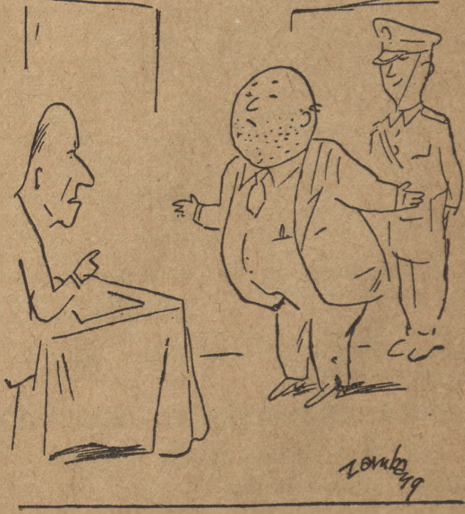
PROKURATOR: I pan nie wstydział się wziąć 3 tysiący łapówek. OSKARŻONY: Wstydziałem się bardzo. Ale nie chciałem więcej dać.

W twierdzeniu tym zawarte są pozory prawdy. W portach Neapolu, Taranto, Livorno, Genui i wielu innych roi się od pałastycznych i gwiazdzystych flag, powiewających na amerykańskich okrętach wojennych, wbrew postanowieniom traktatu pokojowego, który zobowiązywał zwycięskie mocarstwa do wycofania sił zbrojnych z Włoch. Ale stał się on dla floty amerykańskiej, a lotniska włoskie zostały oddane do dyspozycji sił powierniczych Stanów Zjednoczonych.