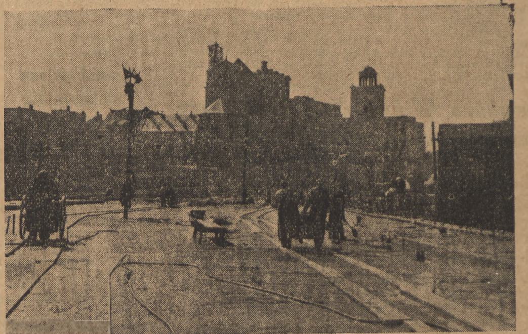
Z nastaniem wiosny tempo prac na trasie W-Z jeszcze bardziej się wzmożło. Na zdjęciu fragment trasy widziany od strony Wisły