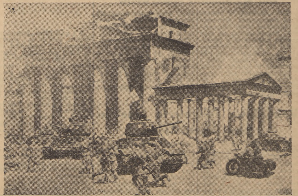
Obraz Leona Wróblewskiego przedstawiający radzieckich i polskich żołnierzy w zdobywym Berlinie. Po zwycięskim zakończeniu wojny podpisano dnia 2 sierpnia 1945 roku układ poczdamski.