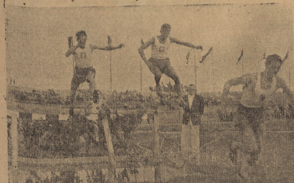
Warszawie odbyły się międzyrodowe zawody lekkoatletyczne Polska — Rumunia. Na fotografii: fragment biegu z przeszkodami.