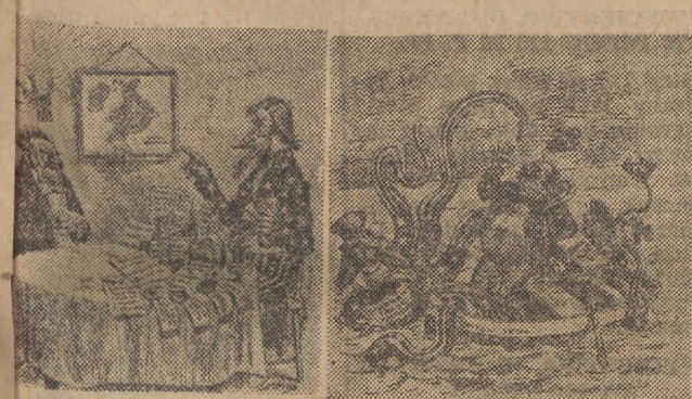
Amerykańska konkurencja atakuje