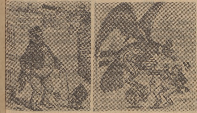
Amerykańskie lłoytacje angielskiej własności