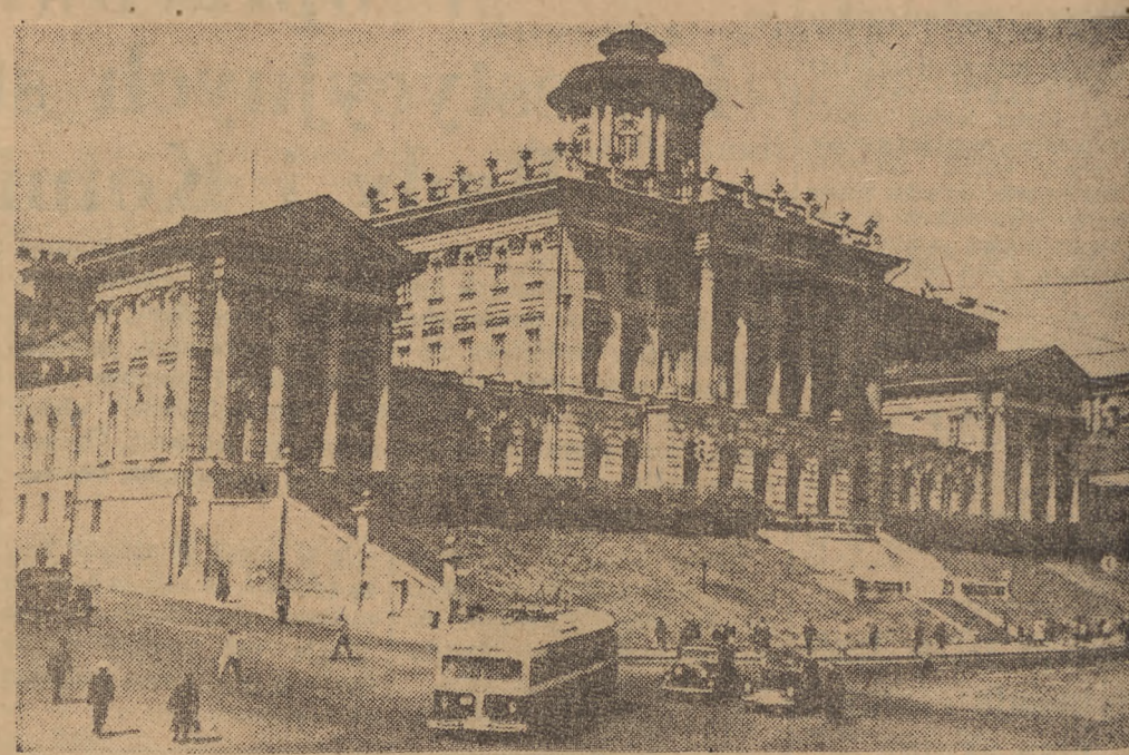
Piękno architektury radzieckiej jest powszechnie znane. Na fotografii: gmach Biblioteki im. Lenina w Moskwie, zbudowany wg projektu W. Bazhenowa.