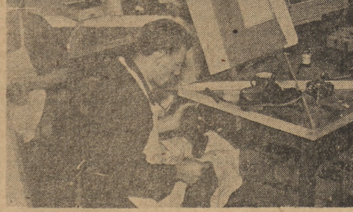
W Zakładzie Doskonalenia Rzemiosła w Warszawie zakończył się eksperymentalny kurs szkolenia w zawodzie szewskim metodą art. malarza Jana Chrzana. Metoda ta skraca czas nauki we wszystkich zawodach o przeciętnego okresu 6 miesięcy. Na fotografii: praca ucznia szewskiego

W Zakładzie Doskonalenia Rzemiosła w Warszawie zakończył się eksperymentalny kurs szkolenia w zawodzie szewskim metodą art. malarza Jana Chrzana.