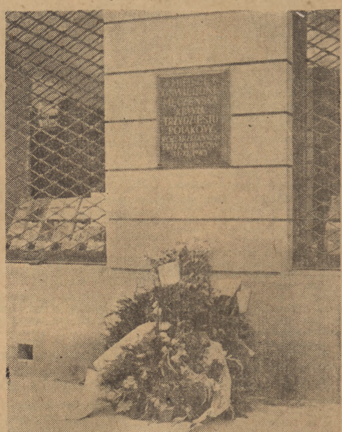
W piątą rocznicę wybuchu Powstania Warszawskiego złożono wieńce na miejscach stracił w Warszawie. Na zdjęciu tablica pamiątkowa na Nowym Świecie.