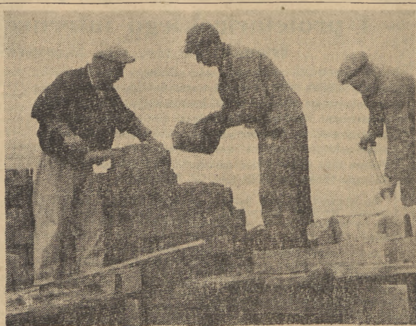
1939—1949: Hitlerowcy burzyli — robotnicy odbudowują.

Dla każdego uczciwego Polaka, dla każdego patrioty i demokracji było rzeczą jasną, że każda próba odbudowy tamtej Polski jest ciosem śmiertelnym w samą ideę niepodległości. Jeżeli bohaterska ofiara żołnierza polskiego, bojownika i partyzanta podziemia, jeżeli okrutne cierpienia całego narodu w latach okupacji nie miały pójść znowu na marne — to nowa Polska musiała być odbudowana na innych zupełnie podstawach. W podziemiach konspiracji okupacyjnej —