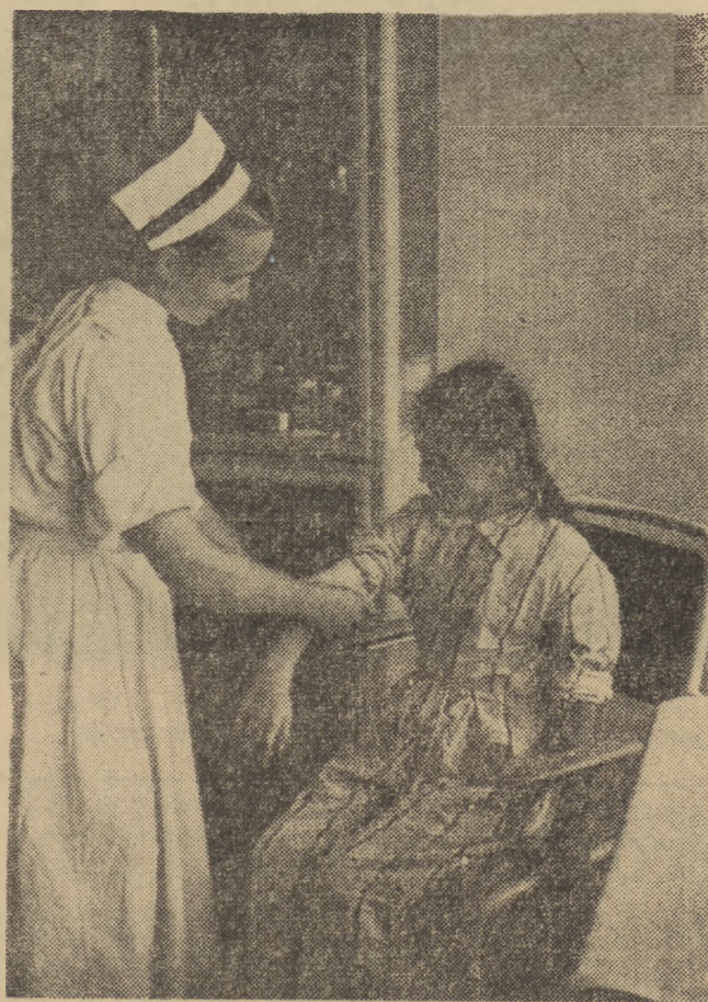
W preventorium w Dzierżynie leczą się dzieci zagrożone gruźlicą. Dzieci kierują do preventorium Zwiazki Zawodowej...