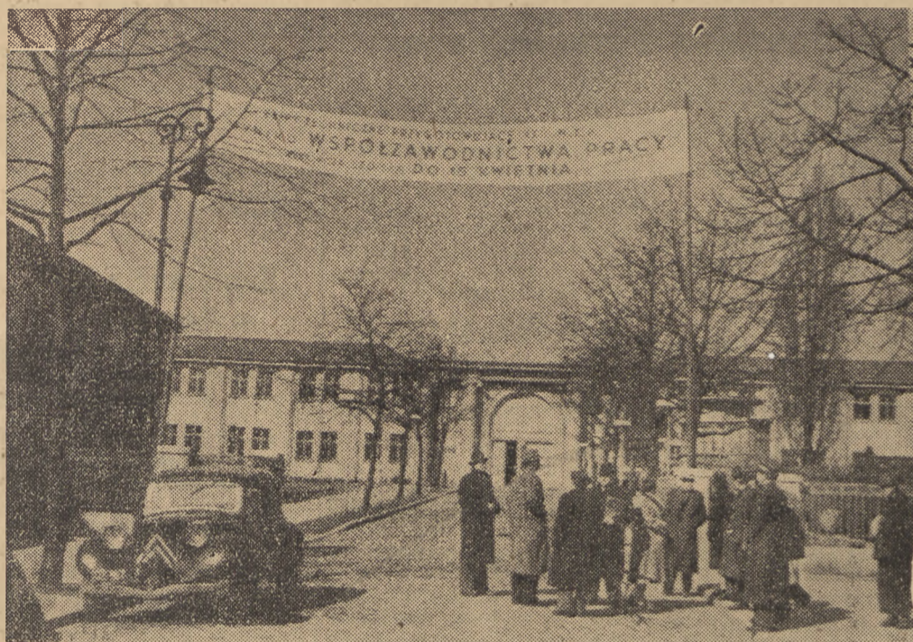
Nad głównym wejściem na teren Międzynarodowych Targów Poznańskich wisi transparent z napisem: „Ekipy techniczne przygotowujące XXII MTP w wyniku współzawodnictwa pracy wykończą stoiska do 15 kwietnia”