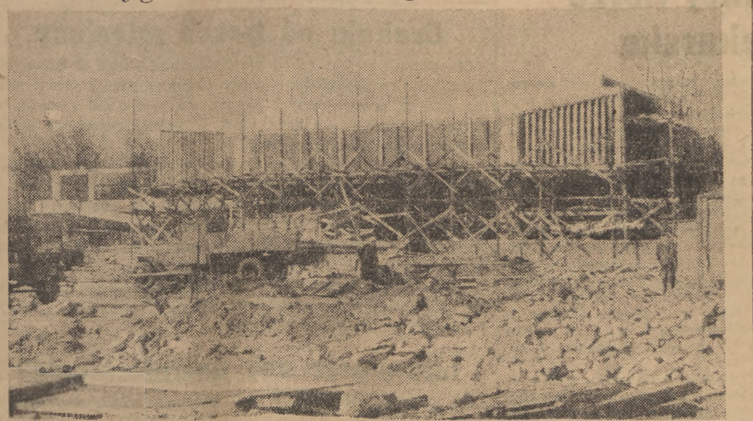
Budowa nowoczesnego pawilonu Ministerstwa Komunikacji jest już na ukończeniu.