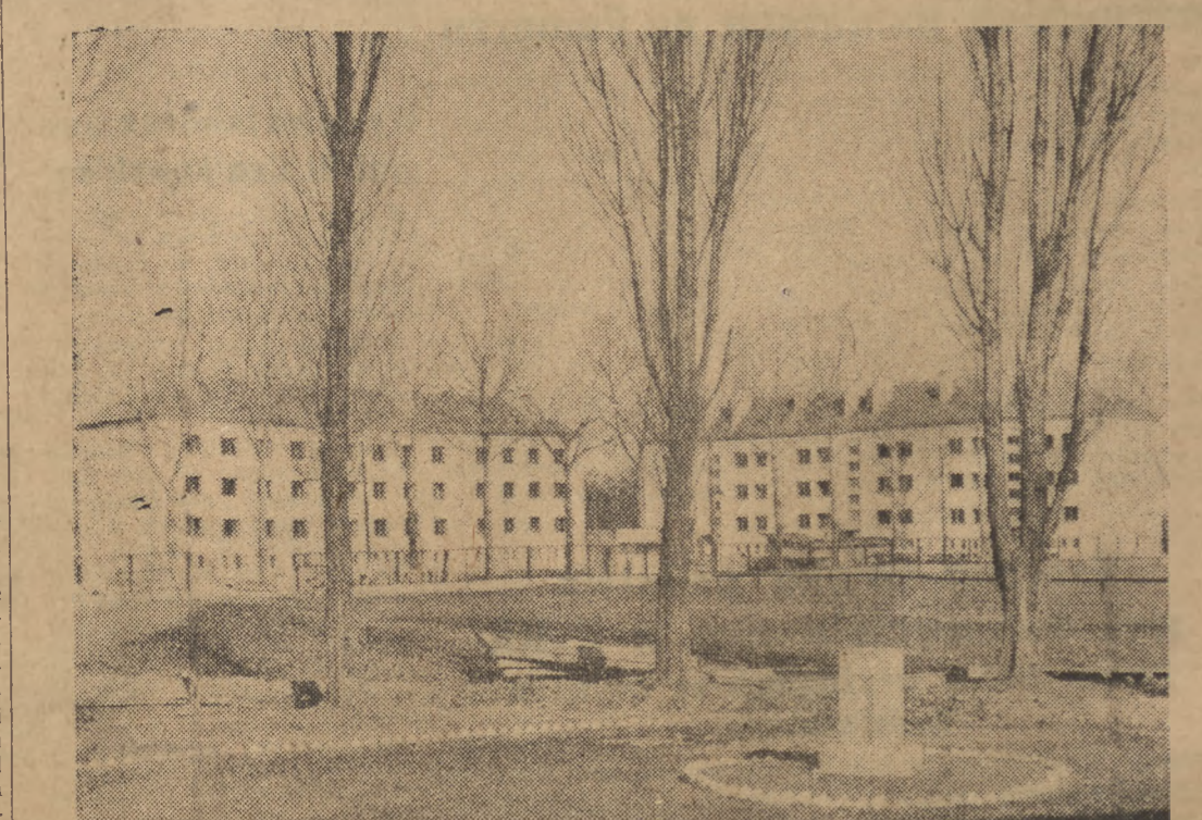
1 maja robotnicy huty „Ostrowiec” otrzymają 108 mieszkań. Aktywność partyjną i administracyjną huty zobowiązały się w ramach Czynu Pierwszomajowego przyspieszyć budowę kolonii robotniczej