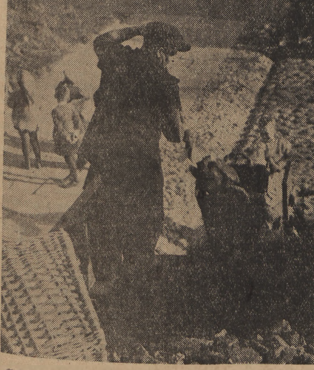
Celem zaopatrzenia ludności stolicy w opał na zimę, Centrala Zbytu Produktów Przemysłu Węglowego, Oddział w Warszawie, zorganizowała drobnicową sprzedaż węgla w obojornymokowego.