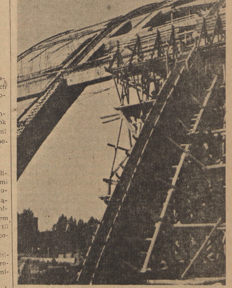
Budowa nowych hal, stadionów i urządzeń sportowych gwarantuje rozwój polskiego sportu. W Łodzi buduje się obecnie nową halę sportową przy ul. Żeromskiego.