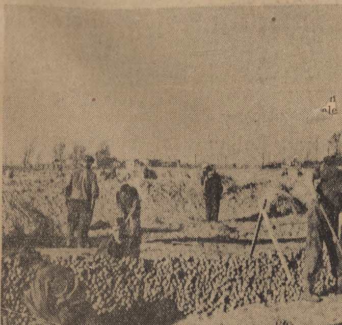
Warszawska Spółdzielnia Sp. z o.o. czyniwo zaopatruje mieszkańców stolicy w ziemniaki. 8 tona ziemniaków zakupiła w Goleścinie. Na zdjęciu pracownicy SP zatrudnieni przy kopczeniu.