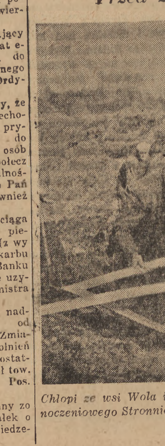
Chłopi ze wsi Wola i Wólka Dużyniecka zobowiązali się do zjednoczenia Stronnictwa Ludowego i budowy kanału odwadniającego. Kanał ten przebiegnie przez pastwiska do rzeki Wkrzy.