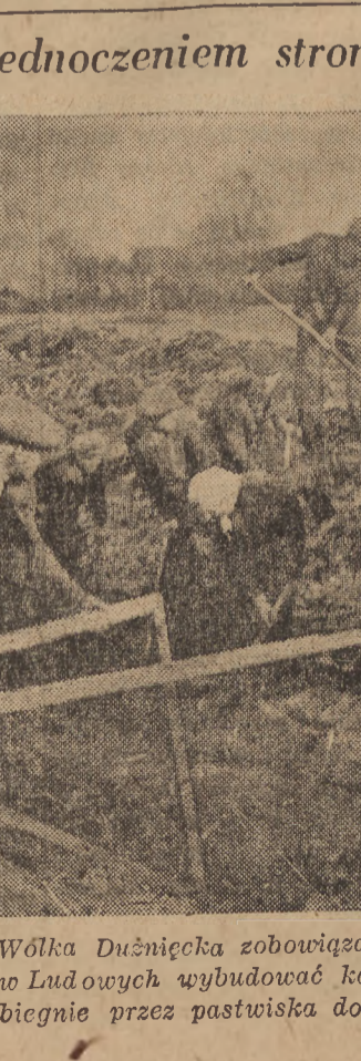
Chłopi ze wsi Wola i Wólka Dużyniecka zobowiązali się do zjednoczenia Stronnictwa Ludowego i budowy kanału odwadniającego. Kanał ten przebiegnie przez pastwiska do rzeki Wkrzy.