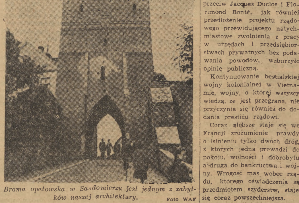
Brama opatowska w Sandomierzu jest jednym z zabytków naszej architektury.

Wskrócie po oświadczeniu Guy Molleta, sekretarza generalnego partii socjalistycznej, że „niebezpieczeństwo gaullistowskie” jest mniejsze od „niebezpieczeństwa komunistycznego” nastąpiła wypowiedź Georges Bidault, że MRP skłonne byłoby pod pewnymi warunkami stać się stadem owieczek pastera de Gaulle'a.