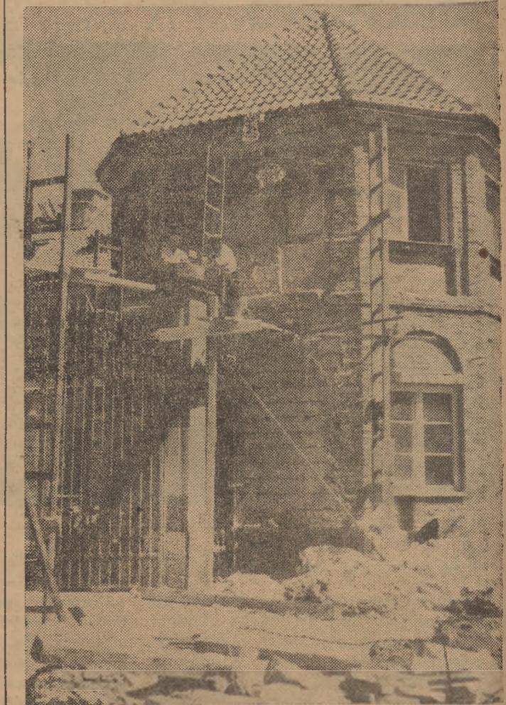
Na placu Teatralnym w Warszawie prowadzi się prace przy odbudowie pałacu Błaska.