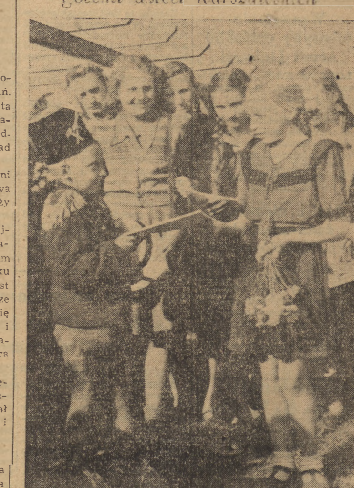
Dzieci ogródka jordanowskiego im. Małgorzaty Fornalskiej w Warszawie gościły dzieci górnicze i hutnicze z Siemianowic Śląskich. Gości zwiędzili Warszawa, byli w Wilanowie, w ogrodzie botanicznym. Na pożegnanie otrzymali od dzieci warszawskich album pamiątkowy.